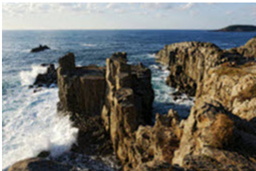
บริษัท เจแปนพาราไดซ์ ทัวร์ จำกัด